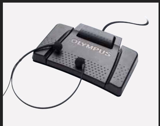
AS-9000 comprend RS-31H, E-102, ODMS Module Transcription (Licence unique)

ODMS module de Transcription offre un interfaçage avec Dragon NaturallySpeaking* pour réduire d'autant plus le temps de transcription.