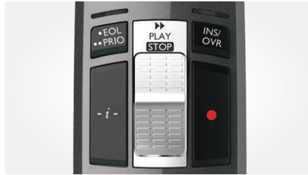
Bedienung per Schiebeschalter (schneller Vorlauf, Aufnahme/Wiedergabe, Stopp, schneller Rücklauf)