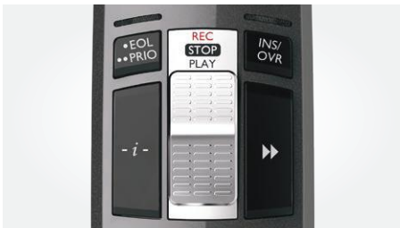
Bedienung per Schiebeschalter (Aufnahme, Stopp, Wiedergabe, schneller Rücklauf)