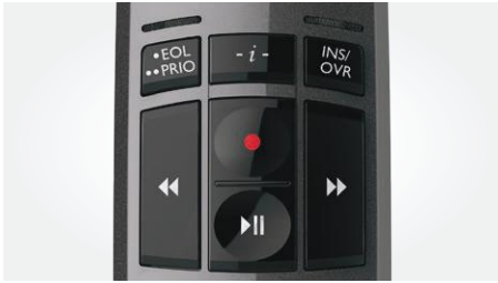
Bedienung per Drucktasten