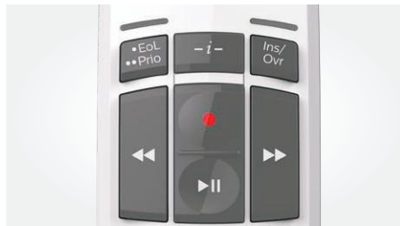
Bedienung per Drucktasten Limitierte Ausführung in Weiß